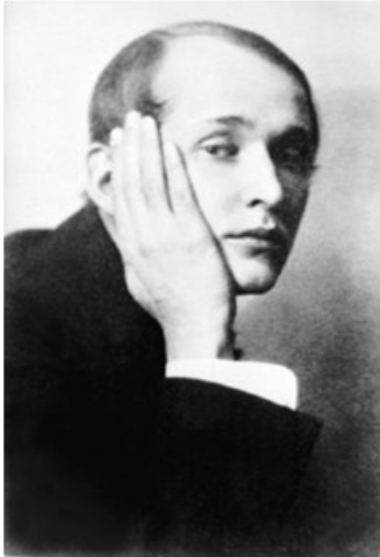
21 марта 1889 – 21 мая 1957 Александр Николаевич Вертинский