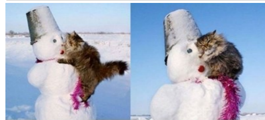
О, СНЕГОВИЧОК, Я ТАК ТЕБЯ ЛЮБЛЮ...