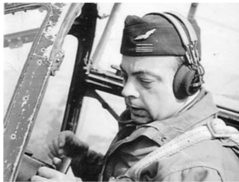
французский писатель, поэт и профессиональный лётчик 29 июня 1900г. - 31 июля 1944г.

- Самого главного глазами не увидишь, — повторил Маленький принц,