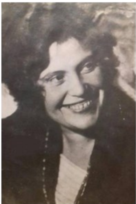
Ада Артемьевна Чумаченко (9 сентября 1887, Таганрог — 5 мая 1954) — русская поэтесса и писательница, драматург