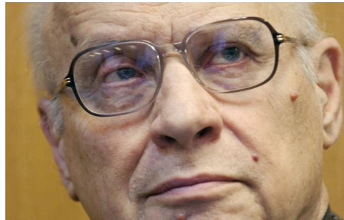
Владимир Карлович Железников, (26 октября 1925—3 декабря 2015) — русский советский детский писатель, кинодраматург. Лауреат Государственной премии СССР (1974, 1986), заслуженный деятель искусств Российской Федерации (1995)

– Если ты будешь психовать, – сказала Ленка, – то я перестану рассказывать.