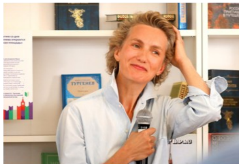
Анна Гавальда (род. 9 декабря 1970, Булонь-Бийанкур) — популярная французская писательница

Но долго я так не выдержал. Захотелось хоть чем-нибудь занять руки... Я стал осматривать дом на предмет того, чтобы что-нибудь улучшить. Мама часто жаловалась при мне на горы глажки и говорила, что ее мечта — гладить сидя. Вот я и взялся решить эту задачу. Разобрал ножки гладильной доски — там был упор, и сделать ее ниже не получалось, — высчитал нужную высоту и установил доску на четыре деревянные ножки, как обычный стол. Потом отвинтил колесики от старого сервировочного столика — я нашел его напротив дома неделю назад — и приладил их к стулу, на котором давно никто не сидел. Еще и подставку для утюга переделал, потому что мама недавно купила новый, другой модели, здоровенный «Мулинекс» с пароувлажнителем, и я сомневался, что старая подставка его выдержит. На это у меня ушло полных два дня. Потом я принялся за мотор газонокосилки. Разобрал его полностью, хорошенько почистил и снова собрал по винтику. Косилка завелась с пол-оборота. Отец меня не слушал, а я то знал, что не надо везти ее в ремонт, все просто из-за грязи. В тот вечер в доме дышалось чуть полегче. Мама приготовила на ужин гренки с ветчиной, сыром и яйцом, мои любимые, вроде как в награду, а отец не стал включать телевизор.